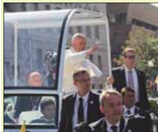
(prosegue da DSVL 21/07/17)