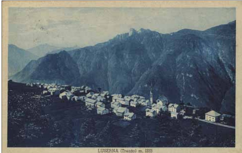
LUSERNA (Trento) m. 1333