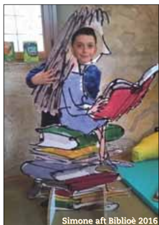
Simone aft Biblioè 2016

TUTTE LE MOSTRE DEL CENTRO DOCUMENTAZIONE LUSERNA SONO APERTE TUTTI I GIORNI CON IL SEGUENTE ORARIO agosto: 9.30-12.30 e 14-18.30; dal 1/9 al 5/11: 10-12.30 e 14-18